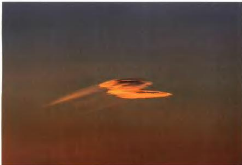
↑ Arrival (Άφιξη). Τα σύννεφα φιγουράρουν συχνά στις λήψεις του.