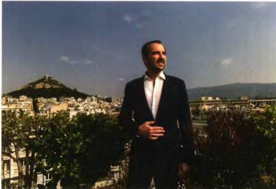
↑ Ο πρίγκιπας Νικόλαος φωτογραφημένος στην ταράτσα της Αθηναϊκής Λέσχης με την προνομιακή θέα.

Την ώρα που μπήκα στην Αθηναϊκή Λέσχη, Εγγλέζα στο ραντεβού μου για τη συνέντευξη με τον πρίγκιπα Νικόλαο , εκείνος είχε φτάσει ήδη πριν από εμένα και άκουγε προσεκτικά τις οδηγίες του φωτογράφου του «Κ», Δημήτρη Βλάικου. Η συνάντησή μας με τον δευτερότοκο υιό του Κωνσταντίνου και της Άννας-Μαρίας πραγματοποιήθηκε λίγες ημέρες προτού αναχωρήσει για την Κοπεγχάγη, όπου την 1η Μαρτίου εγκαινιάστηκε έκθεση με δικές του καλλιτεχνικές λήψεις.