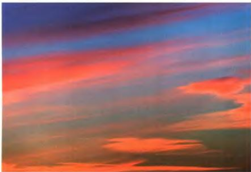
↑ Ethereal Abstraction II. Έργο μεγάλων διαστάσεων από την έκθεση στη Δανία.

«Αναζητούσα μια λευκή επιφάνεια και μου ήρθε στο μυαλό το μάρμαρο της Θάσου, ένα καθαρά ελληνικό υλικό. Με μια νέα τεχνική, καταφέραμε να κάνουμε εκτυπώσεις σε μάρμαρο πάχους ενός πόντου».